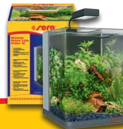
Biotop Nano LED Cube 16 Acquario completo con accessori di alta qualità

Grazie alle sue dimensioni ridotte, il sera Biotop Nano LED Cube 16 può essere inserito senza problemi in qualsiasi ambiente e spazio. È perfettamente adatto per un bellissimo aquascape con gamberi o con alcuni pesci di piccole dimensioni.